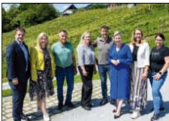
Zu Gast beim Weinhof Zieger

„Es freut mich, dass wir unserer Bundesministerin einen Einblick in unseren Familienbetrieb im Südburgenland geben konnten. Wir sind stolz auf unsere Klein-