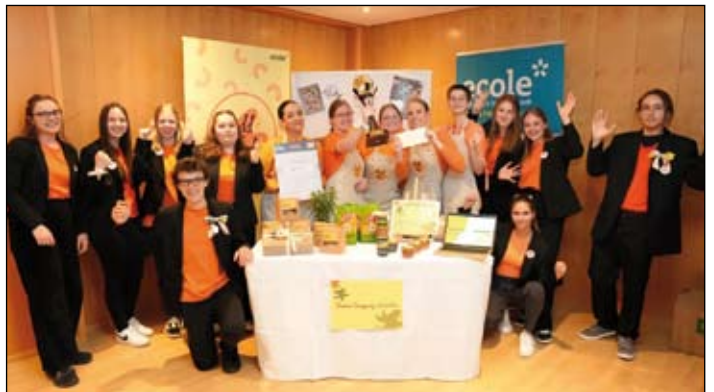
Großer Jubel bei den Gewinnern „kuddl nudl“.